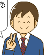
グリーンセミナー塾生の声